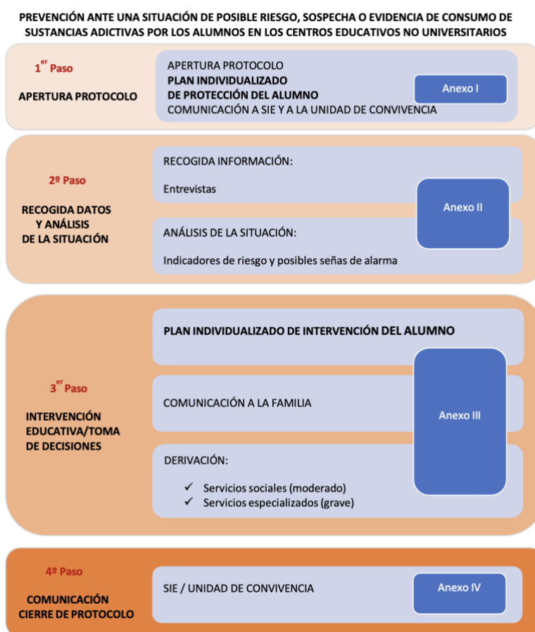
Diagrama de actuaciones