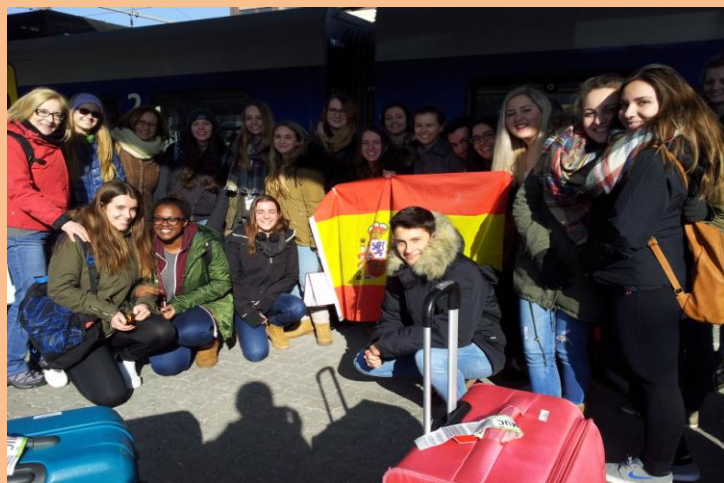
Llegada y encuentro en Kufstein. ¡Una semana por delante llena de emociones!