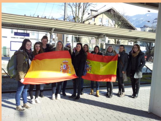
Estación de tren de Kufstein. Las alumnas austriacas esperando nuestra llegada.

A continuación os ofrecemos una galería de fotos en las que hacemos un breve repaso por algunas de las actividades y experiencias que hemos vivido.